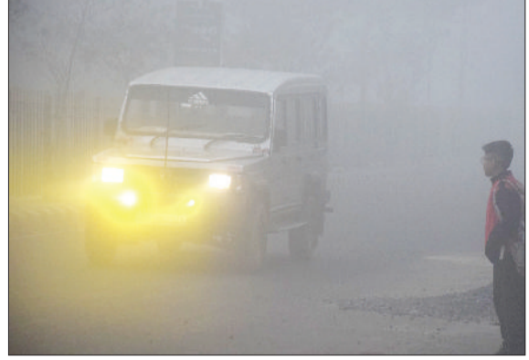
रोहतक। बुधवार को कोहरे के बीच गुजरते वाहन