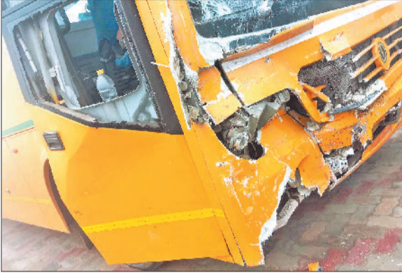
रोहतक। कोहरे में हुए हादसे के बाद क्षतिग्रस्त बस।