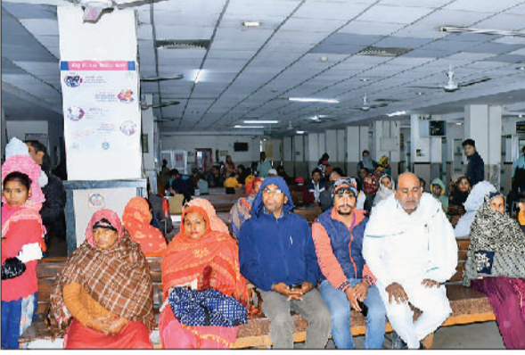
हड़ताल के दौरान डॉक्टर का इंतजार करते हुए मरीज।