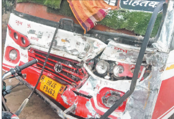
रोहतक। कोहरे में हुए हादसे के बाद क्षतिग्रस्त बस।