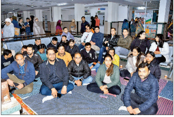
रोहतक। अपनी मांगों के लिए सिविल अस्पताल में धरना देते हुए डॉक्टरों।